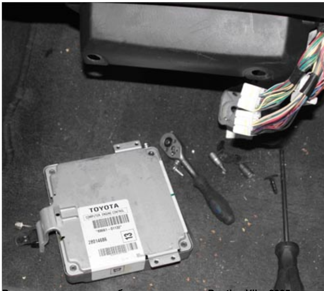
Вид на печатную плату блока управления Pontiac Vibe 2005 года выпуска.